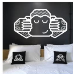
Black & White Monkey