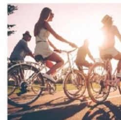
Craft & Cycling Community